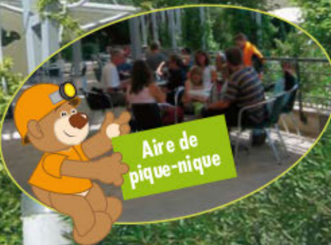
Aire de pique-nique

Toute l'année, à la grotte des Demoiselles ce sont aussi : Des visites-conférences... Des concerts... Des spectacles... Des ateliers pédagogiques... Des visites à thèmes... Des repas de groupe... Visitez le site internet www.demoiselles.fr