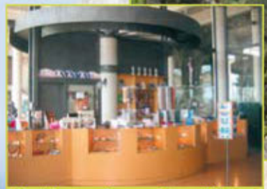
Boutique - Souvenirs - Bijoux