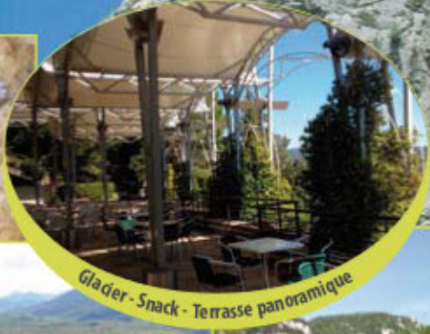
Glacier - Snack - Terrasse panoramique