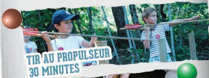
TIR AU PROPULSEUR 30 MINUTES