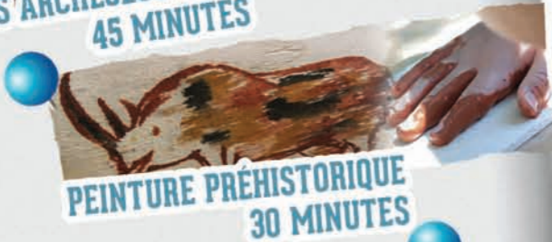
PEINTURE PRÉHISTORIQUE 30 MINUTES