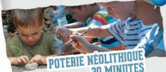
POTERIE NÉOLITHIQUE 30 MINUTES