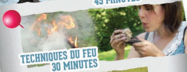
TECHNIQUES DU FEU 30 MINUTES