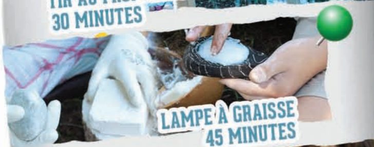
LAMPE À GRAISSE 45 MINUTES