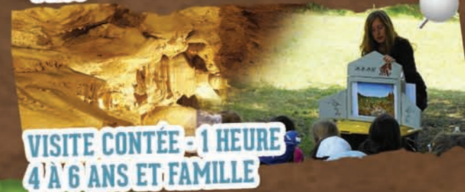
VISITE CONTÉE - 1 HEURE 4'À 6' ANS ET FAMILLE