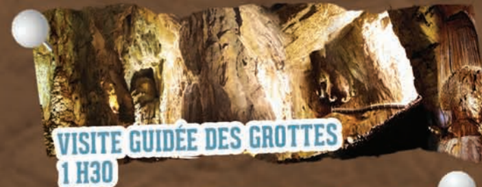
VISITE GUIDÉE DES GROTTES 1 H30