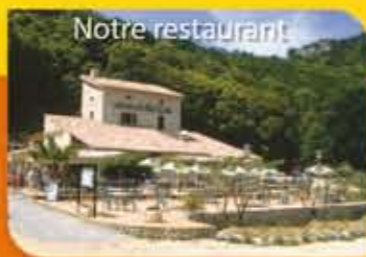
L'Auberge du Pont d'Arc www.ardeche-restaurant.com