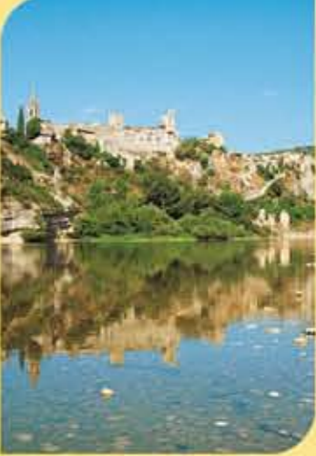
VUE RIVE DROITE À L'ARRIVÉE